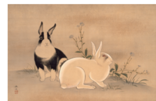
森徹山 《兎図》 Mori Tetsuzan Rabbits

そっと咲く秋の草花と白うさぎを写した、愛らしくも端正な練切り。胡麻の香りがやさしく広がります。(胡麻入りこしあん)