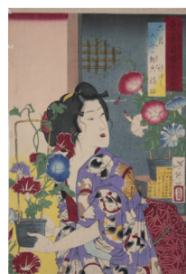
月岡芳年 《東京自慢十二月 六月 入谷の朝顔 新ばし 福助》 太田記念美術館蔵 前期展示:8/9~8/31 Tsukioka Yoshitoshi The Pride of Tokyo's Twelve Months: June, Morning Glories at Iriya Ōta Memorial Museum of Art

練切りをつややかな寒天で包み、夏盛りの朝、露に濡れた朝顔をイメージしました。菊家特製のこしあん入りです。(こしあん)