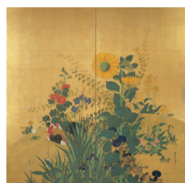
鈴木其一 《四季花鳥図》(右隻) Suzuki Kiitsu Birds and Flowers of the Four Seasons

夏の日差しをいっぱい浴びて咲く向日葵をモチーフにしました。杏入りの練切りは、ほのかに甘酸っぱい仕上がりです。(杏入り練切り・こしあん)