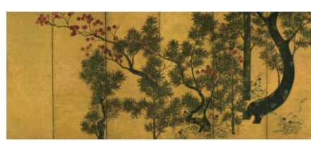
伝 俵屋宗達 《槭楓図》 Attributed to Tawaraya Sōtatsu Chinese Black Pines and Maple Trees

俵屋宗達作と伝わる《槭楓図》をもとに、緑のきんとんで槭の葉を、錦玉羹で楓の葉を表しました。中は上質な黒糖を使った大島あんです。(黒糖風味大島あん)