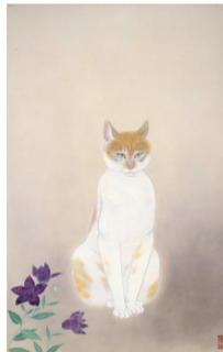
小林古径 《猫》 Kobayashi Kokei Cat

凧とした猫の柔らかな毛並みをきんとんで表現し、錦玉羹でつくった桔梗の花をアクセントに添えました。上質な黒糖を使った大島あん入りです。(黒糖風味大島あん)