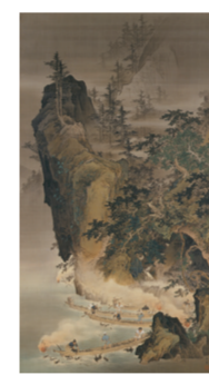
川合玉堂 《鶺鴒》 Kawai Gyokudō Cormorant Fishing

川面に揺れる篝火の明かりを錦玉羹で、鮎は羊羹、川底の石は胡麻入り白あんで表しました。玉堂が描いた鶺鴒の情景をイメージした和菓子です。(ワイン風味錦玉羹・胡麻入り白あん・羊羹) ※アルコールは含まれません。