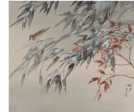
松林桂月 《春雪》 Matsubayashi Keigetsu Spring Snow

春の雪がうっすらと積もる葉と、南天の赤い実と葉をかたどりしました。中は素材にこだわった菊家特製のこしあんです。(こしあん)