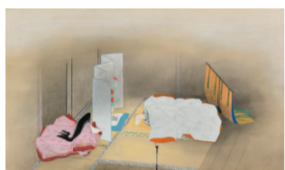
小林古径 《清姫》のうち「寝所」 Kobayashi Kokei Sleeping Quarters: Scenes from the Legend of Kiyohime

小林古径の代表作《清姫》をモチーフに、可愛らしい和菓子に仕上げました。白あんに入った杏の風味もお楽しみいただけます。(杏入り白あん)